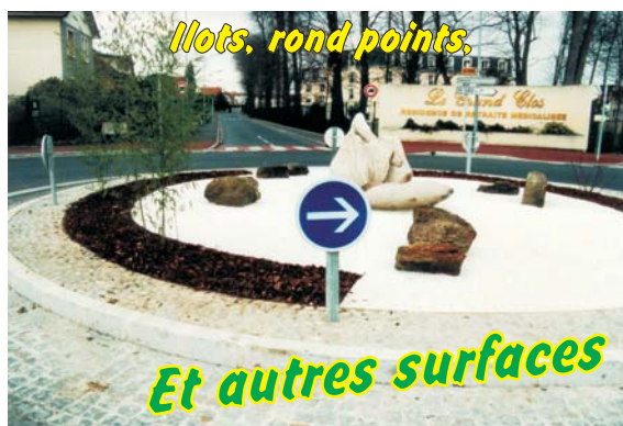
Ilots, rond points,